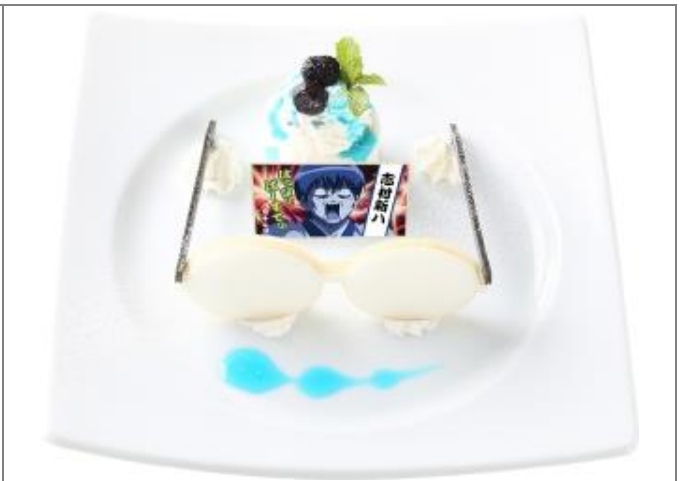
【期間限定】 志村新八のバースデープレート 1,100円