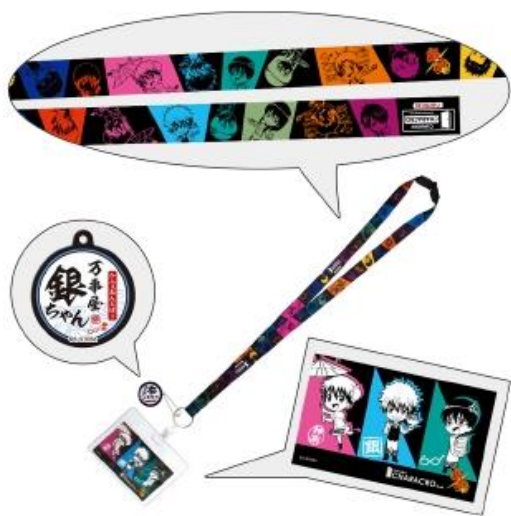
ネックストラップ 1,580円