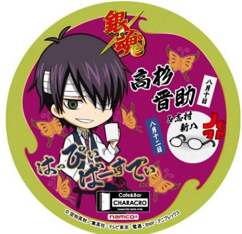
「高杉晋助&志村新八誕生祭」記念コースター