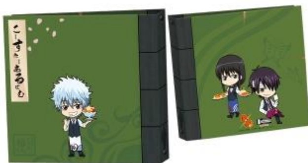
コースターアルバム 1,700円