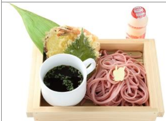
【期間限定】 高杉の紫蕎麦 1,200円