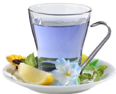
僕はね、花になりたいんです (屁怒組) 680 円