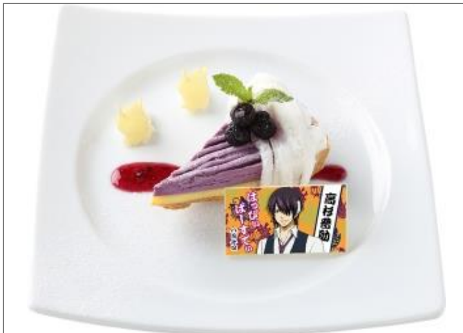
【期間限定】 高杉晋助のバースデープレート 1,100円