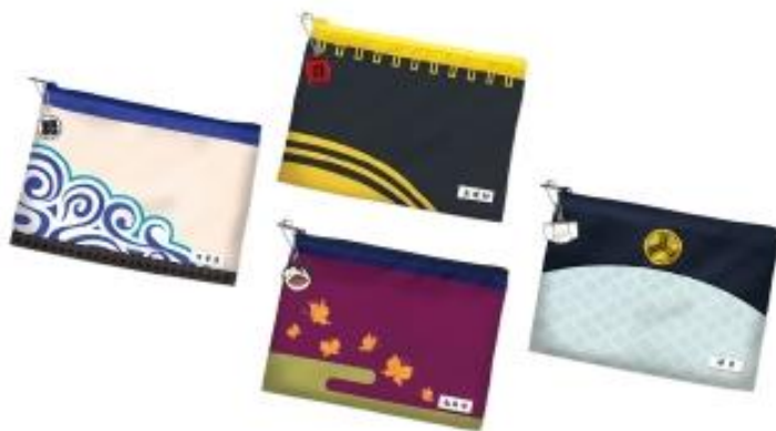
ミニポーチ (アクリルチャーム付 / 全4種) 各1,800円