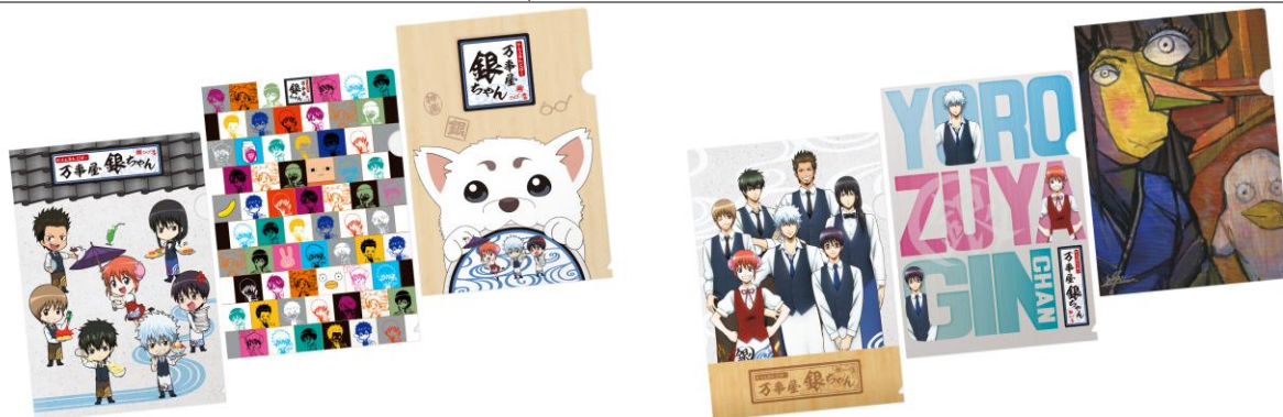
クリアファイル3枚セット (全2種) 各1,050円