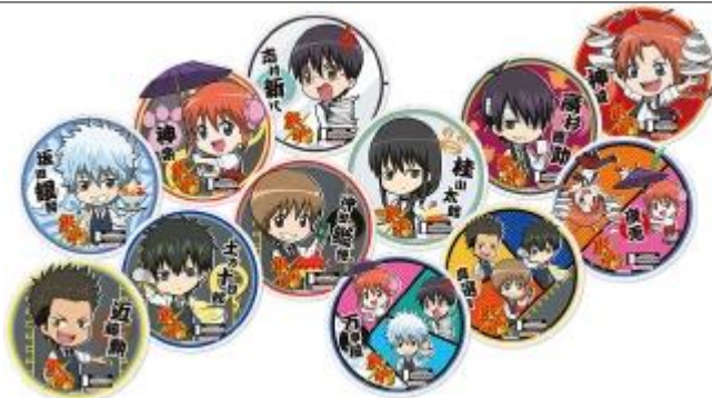
コースターセット (12枚セット) 780円