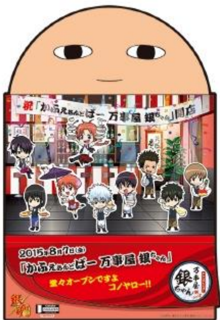
オープン記念ステッカー 800円

「カフェ&バー CHARACRO feat. 銀魂」オリジナルグッズを販売します。オープン以降も随時新アイテムを追加します。