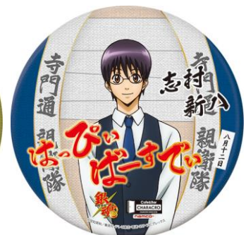
【期間限定】 高杉晋助 誕生祭記念スタンド缶バッジ 志村新八 誕生祭記念スタンド缶バッジ 各 870円