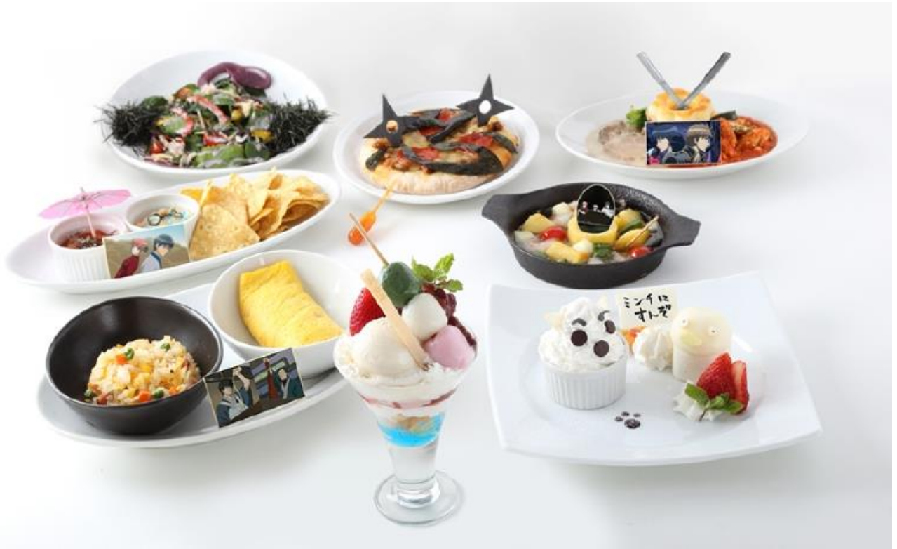
上段左から「お前らいい加減にしろよサラダ」 850 円 「服部全蔵&さっちゃんの忍々PIZZA」 1,200 円 「沖田 vs 信女の激闘 2 色シチュー」 1,250 円 中段左から「新八&神楽のコンビナチョス」 800 円(税込) 「たまと万事屋のクエストアヒージョ」 950 円 下段左から「マヨラーvs ケチャラー プレート」 1,200 円 「銀さんの宇治銀時丼パフェ」 850 円 「永遠のライバルアイスプレート」 1,300 円