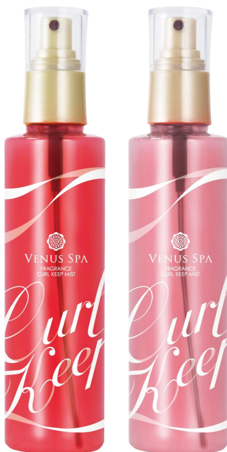
ヴィーナススパ フレグランス カールキープミスト ローズ&ホワイトフラワー /ピンクブーケ&ベビーピーチ

2015 年 9 月 5 日(土)、ヴィーナススパより、 ゆるっとふわ巻きスタイルが一日続く「フレグランス カールキープミスト」を2種類発売いたします。 パーマをサロンではなくその日の気分と自分流アレンジで楽しんでいる現代女性に向けて開発した、 コテ前のひと吹きでアレンジヘアが長続きする高機能キープミストです。 【髪、解けないスタイリング】を是非お試しください。