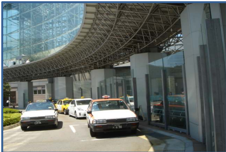
金沢駅構内タクシー入退管理システム (平成25年8月運用開始)