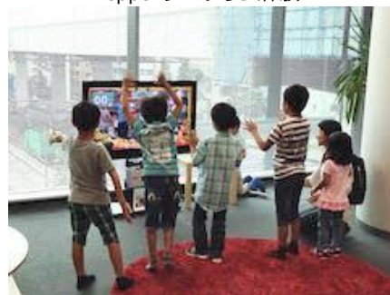
Kinect フルーツキャッチ

当社は、今後もこのような活動を通じて、幅広い世代の方々にデジタルの楽しさを知ってもらうとともに、様々な教育・経験の機会を提供していきたいと考えています。