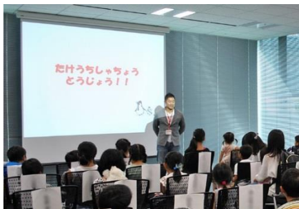
お仕事紹介+社員証授与式

オフィス内にはこどもたちの元気な声があふれ、働く社員も思わず笑顔がこぼれる、明るく活気ある一日となりました。