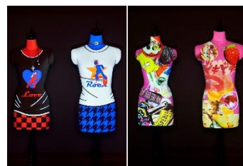
-2014 年度の GALLERY の様子-