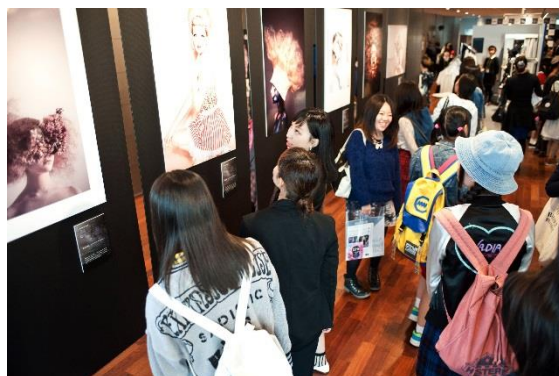
- 2014 年度の様子 -