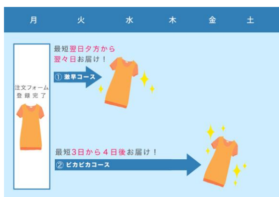
【図① 選べる2つのコース】