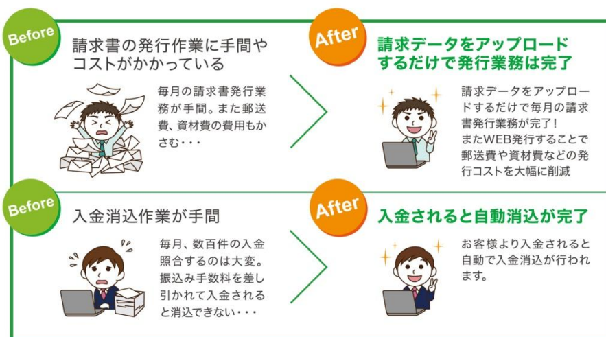
図 1：「楽楽明細」とペイジェント「消込エクスプレス」の特徴

※「楽楽明細」の詳細 http://www.rakurakumeisai.jp/