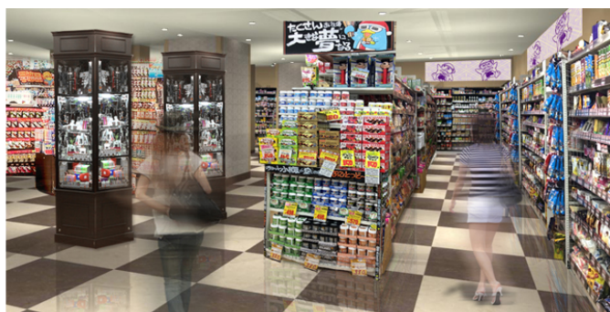
店舗外観・内観 イメージ図 ※実際と異なる場合がございます