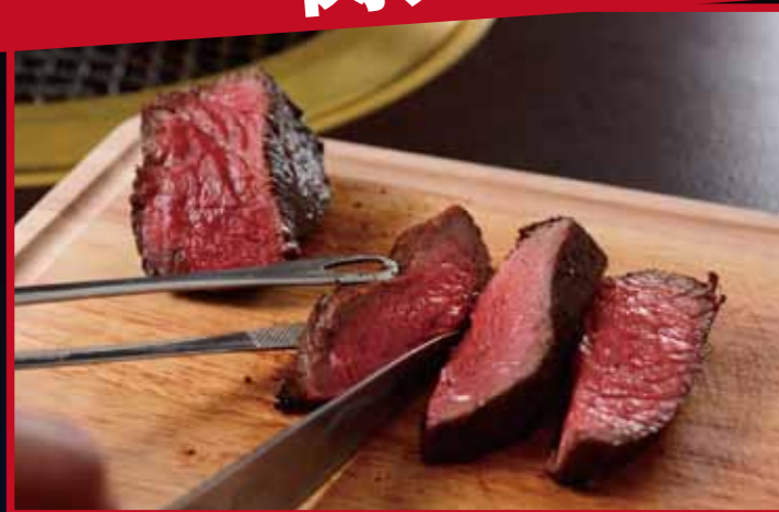
門崎熟成肉焼 門崎熟成肉 格之進