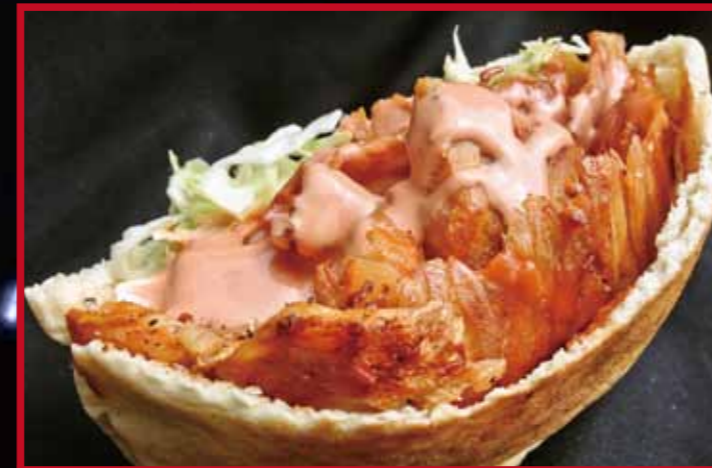
ドネルケバブ(チキンorビーフ) efe ケバブ