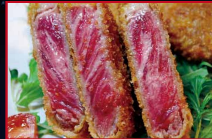
牛かつれつ(九条ねぎのせ) 西麻布 きむらてつ炙り家縁