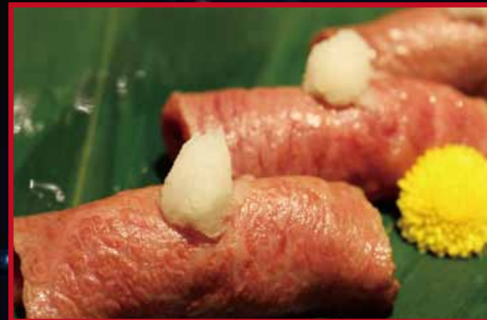
名物!! 黒毛和牛 肉寿司 肉の匠 将泰庵