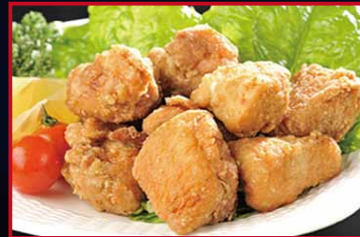
骨なしからあげ 大分県中津からあげ もり山