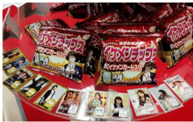
▲名刺交換でプレゼントのイケメンチップス