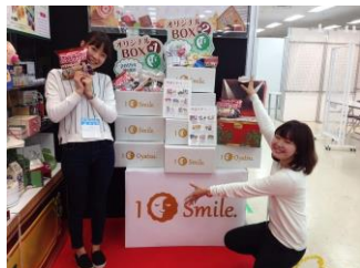
▲出展時の会場の様子