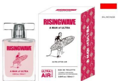
A MAN of ULTRA EAU DE TOILETTE (ウルトラ アタック エアー)

TOP : カシス 、アップル、パイナップル、レモン MIDDLE : ジャスミン、ピーチ、ラフランス LAST : ムスク、アンバー、サンダルウッド