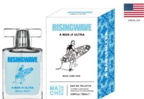
A MAN of ULTRA EAU DE TOILETTE (マッハ チューブ ライド)

ウルトラな海男のウルトラなサーフトリップ。ボード 1 枚で、世界中のどこまでも。 世界有数のサーフスポットでテイクオフ。