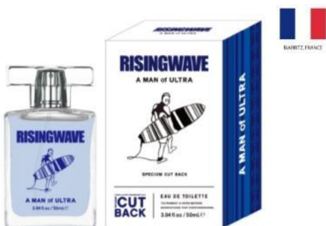
A MAN of ULTRA EAU DE TOILETTE (スペシウム カット バック)

TOP : グレープフルーツ 、シトラスゼスト、 リーフィーグリーン、カシス MIDDLE : ミュゲ、フローラルブーケ LAST : セダーウッド、ムスク