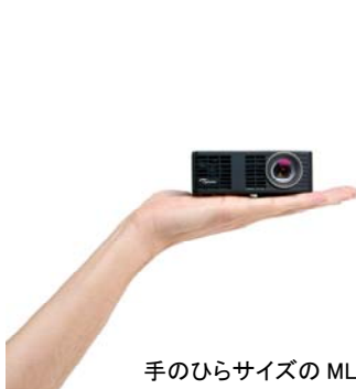
手のひらサイズの ML750