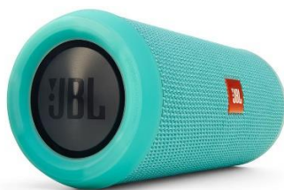
アレンジ部門(1 名様) 応募タグ「ABILITY アレンジ」 Bluetooth スピーカー