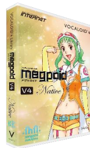
ボーカロイド™部門(1 名様) 応募タグ「ABILITY ボカロ」 VOCALOID™4 スターターパック Megpoid Native

コンテスト詳細は、特設ページ( http://melocy.com/contest/ )から閲覧できるほか、専用アプリからも確認できます。 ※VOCALOID(ボーカロイド)/ボカロはヤマハ株式会社の登録商標です。