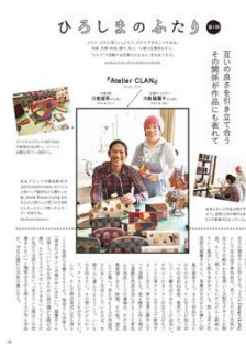
レギュラーコーナー