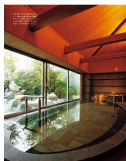
冬号■巻頭特集「大人の宿旅」