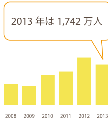
海外旅行者数の推移

フェイスブックやツイッター、mixi などのソーシャルサイトは「食」「買い物」「旅行」の話題と親和性が高い共通のユーザー特製を持っています。「旅」に特化した cocomachi なら、潜在的なユーザーを掘り起こし、集めることができます。