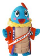
へしこちゃん (美浜町)