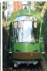
〈左上から〉ボンビドー・センター、関西国際空港旅客ターミナルビル、牛浜ハイヤ大橋、小田急ロマンスカー 50000形VSE、小田急ロマンスカー 60000形MSE、東京・ベルギー大使館、箱根登山電車3000形、大山ケーブル