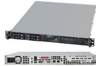
【ラックマウント型(1U):FDC T1W】