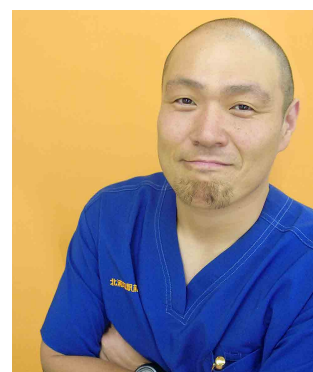
ファンクショナルスタイル 北浦和駅前接骨院