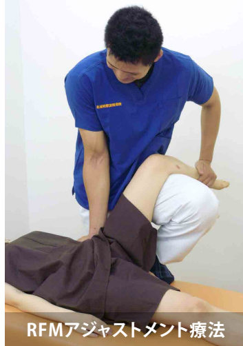
RFMアジャストメント療法