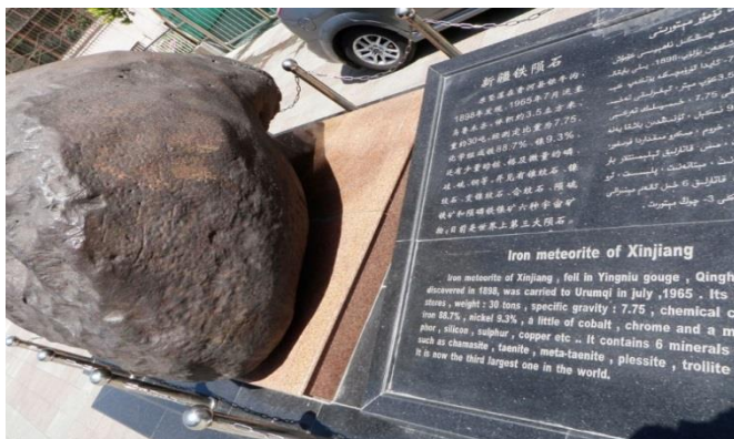
↑ 重さ28tあり、石碑には世界三大隕石と記されているが、現在では世界で4番目に大きいとされている。