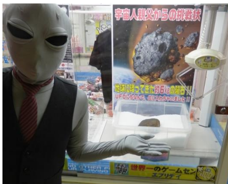
↑ 隕石キャッチャーと宇宙人(親父)