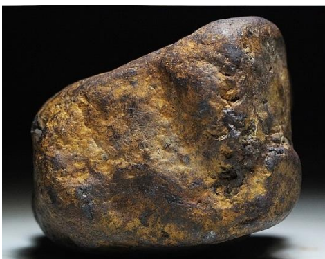
↑ クレーンゲーム機に入っている 本物の隕石