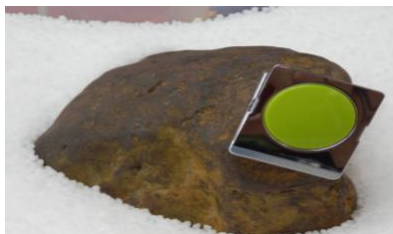
↑ 磁性がある為、マグネットがつく