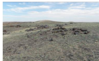
↑ 掘出場所の中国の砂漠