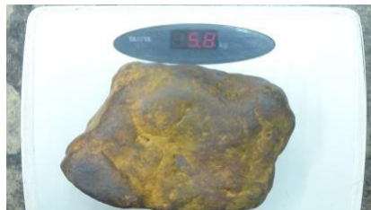
↑ 重さ 約5.8キログラム

中国の新疆(しんきょう)ウイグル自治区に落下した隕石で、新疆鉄隕石と呼ばれているものです。新疆ウイグル族自治区は隕石の散らばる最大産地の一つとして知られており、この隕石は、砂漠の荒涼とした奥地から運ばれてきました。重さは5.78kgあり、大きさは18cm×13cmあり、鉄やニッケルでできているため、見た目よりもとても重く、磁石がつくという性質があります。