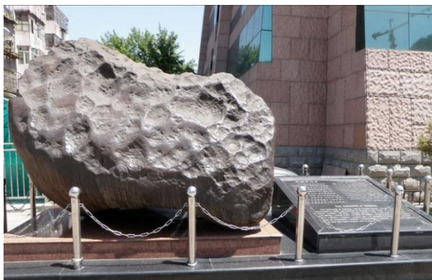
↑ 中国の新疆地質鉱産博物館で展示されている新疆鉄隕石。

新疆鉄隕石は、今から46億年前、惑星のもととなった小天体の中心部、核(コア)を作っていた物質です。溶融状態で均質な物質が100万年前に約1℃の割合で徐々に冷却していく過程で、金属鉄を規則的に結晶した物です。その為、地球上でこの模様を再現することは到底不可能と言われている。