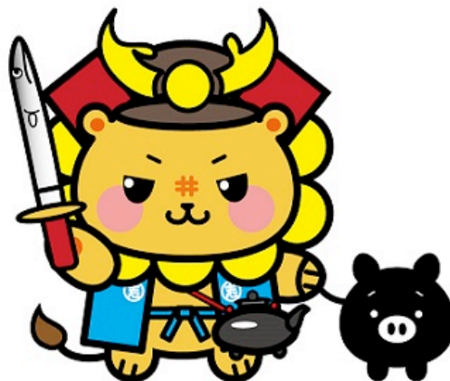
志布志市のゆるキャラ「ししまる」