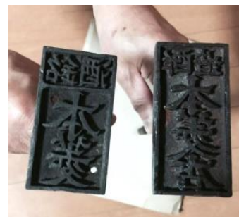
120年前当時、 実際に使われていた「本菱」の刻印

主催：まちいくふじかわプロジェクト（むすび株式会社、株式会社萬屋醸造店、ワンドリーズ株式会社） 後援：山梨日日新聞社・山梨放送・山梨県富士川町 URL： http://www.machi-iku.com/