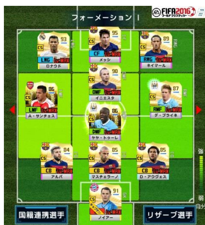
最強イレブン [1/26 発表]