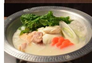
※画像は全てイメージです。