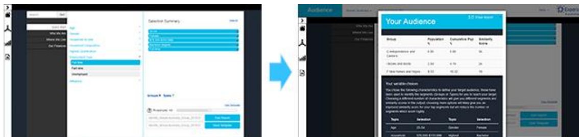
(図 3) 条件を指定すると、適した Mosaic グループが表示（本画像は、表示イメージ例です。実際の表示とは異なります。）

性別、年代、年収などターゲットセグメントの条件を複数選択することで、条件に合致する Mosaic グループ、タイプを導き出すことができます。(図 3) 導き出した Mosaic グループの居住エリアやその他ライフスタイル情報を理解することで、エリアマーケティングやプロモーションの実施に役立ちます。