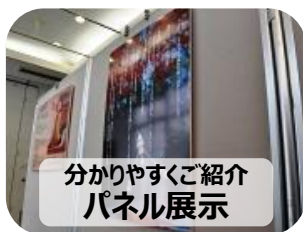
分かりやすくご紹介 パネル展示

今回は3つのところを、パネル展示・ワークショップを通じてわかりやすくご紹介します。