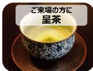
ご来場の方に 呈茶