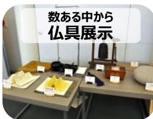
数ある中から 仏具展示