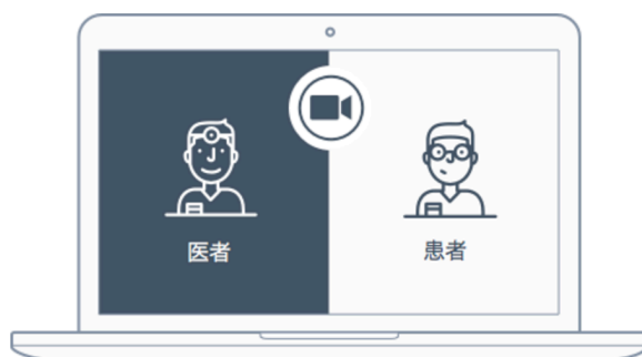
ビデオ診察イメージ