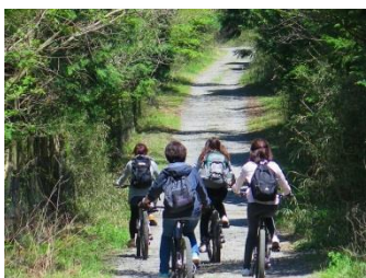
はこじょ初となる マウンテンバイクを使った授業

開催日時 2016年3月20日（日）11：00～15：00（10：30受付開始） 場所 芦ノ湖キャンプ村 参加費（材料費込） 一般：4,800円（税込）／はこじょ学生：3,800円（税込） ＜アウトドアクッキング体験ランチ&箱根のお土産&はこじょ特別温泉割引券＞ 定員 25名（男性の方も参加女性のパートナーや同伴の方であればご参加いただけます） 申込締切 2016年03月15日（火） 参加方法 公式WEBサイトからお申込み（ http://hakojo.com/ ） 主催 箱根町 企画運営 一般社団法人はこねのもりコンソーシアムジャパン 後援協力 箱根ジオパーク推進協議会／芦ノ湖キャンプ村／箱根園／ハコネマウンテンリッパー／株式会社スノーピーク