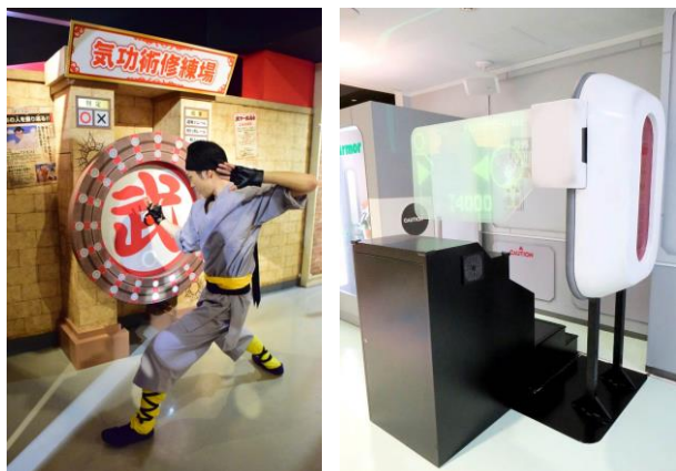
「動体視力」と「戦闘力」を測る2種類のトライアルゲーム