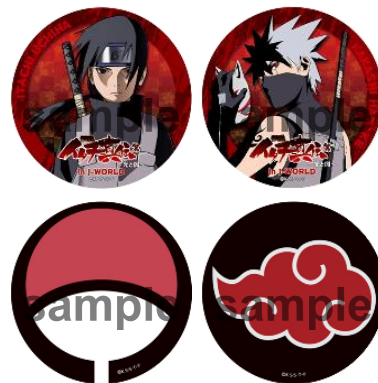
56mm 缶バッジ/全9種 (1個 378円) ※ブラインドパッケージ仕様