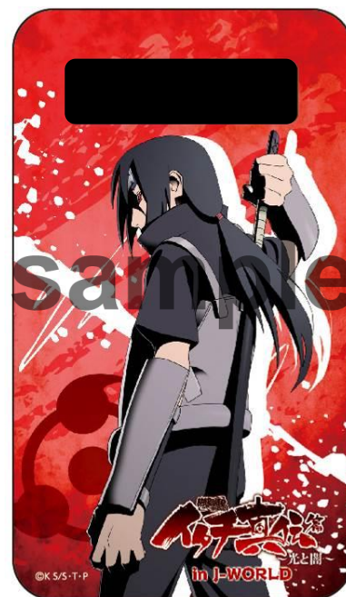
イベント記念限定グッズ 「モバイルバッテリー」