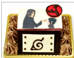
イタチとサスケのケーキ (サワーチェリーケーキ)

レアチーズケーキに、赤色と白色のチョコレートを使ってうちはのマークを表現しました。