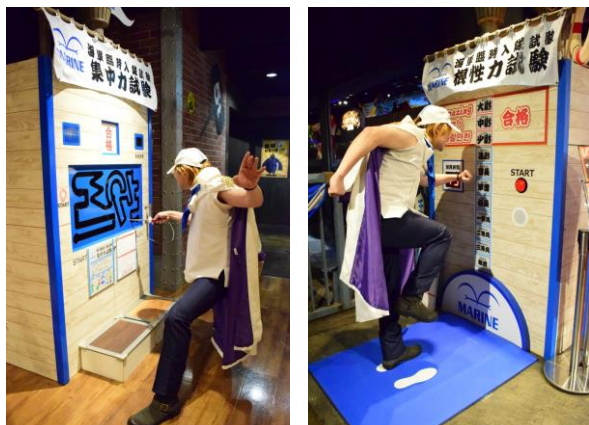
「集中力」と「根性力(体力)」を測る2種類のトライアルゲーム