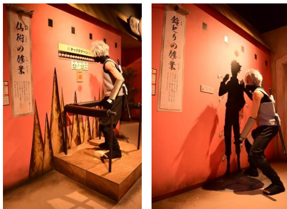
「バランス感覚」と「反射神経」を測る2種類のトライアルゲーム