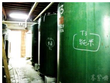
萬屋醸造店の酒蔵