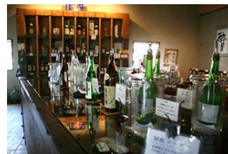
酒蔵ギャラリー 六斎・カフェコクリコ