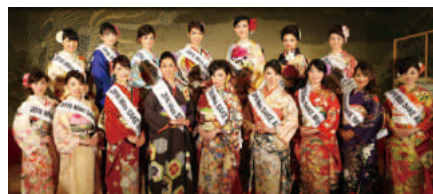
ゲスト: 2016ミス日本酒