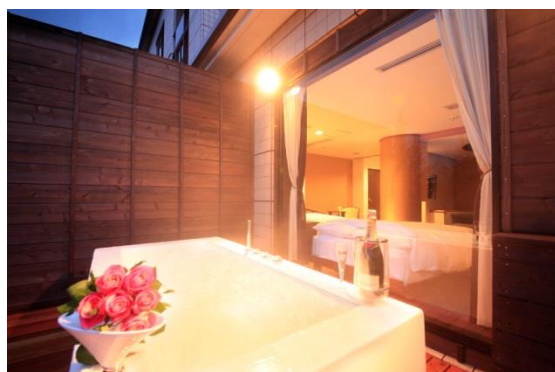
記念日にお勧めの特別室

箱根の温泉旅館【大人の隠れ家 箱根 別邸今宵】（所在地：神奈川県足柄下郡箱根町強羅字強羅 1300-658 公式サイト： http://www.hakone-koyoi.jp/ ）は、2016年3月13日（日曜日）から、1日1組様限定で極上の記念日をお過ごしいただけるプランの販売を開始する。お部屋に生花をいっぱい散りばめ、シャンパンでの乾杯やアニバーサリーケーキの手配など、特別な一日を別邸今宵のスタッフが演出。プロポーズや人生の節目の大切な記念日など、特別な一日の思い出作りを別邸今宵がお手伝いするサプライズ企画。