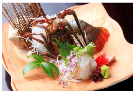
伊勢海老のお造り