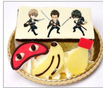
真選組ケーキ (黒ごまケーキ) (720 円)

信女の好物のドーナッツを使って、異三郎が信女を釣っている様子を表現したメニューです。ライスバーガーで異三郎のトレードマークの携帯を、煮たまごのスライスとマヨネーズで片メガネを表現しています。