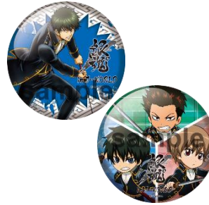
100mm 缶バッジ (4種)