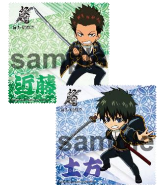
マイクロファイバーミニタオル (3種)