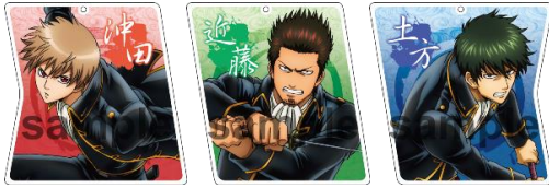
アクリルキーホルダー／全3種 (各 864 円)