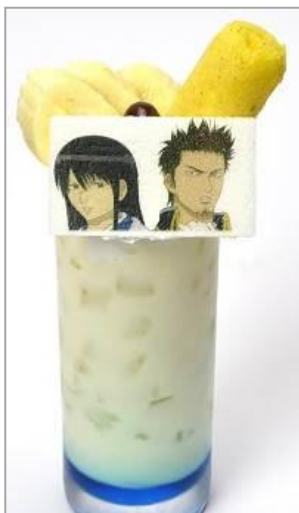
「俺達にもう敵はいない」 近藤と桂の最強タッグバナナオレ (650 円)

真選組の隊服を黒色のケーキで表現しました。ケーキの上には、近藤・沖田・土方をイメージし、チョコレートで作ったバナナ・アイマスク・マヨネーズを添えています。