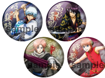
缶バッジ ver.2 (全7種／1個 378 円) ※ブラインドパッケージ仕様