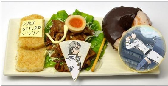
異三郎と信女の日常 ノブたすフィッシングプレート (820 円)

信女の好物のドーナッツを使って、異三郎が信女を釣っている様子を表現したメニューです。ライスバーガーで異三郎のトレードマークの携帯を、煮たまごのスライスとマヨネーズで片メガネを表現しています。