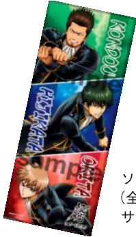
ソフトタッチフェイスタオル (全1種／2,484 円) サイズ：約 340mm × 850mm