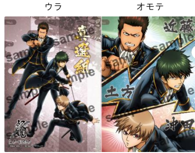
A4 クリアファイル (全1種／378 円)