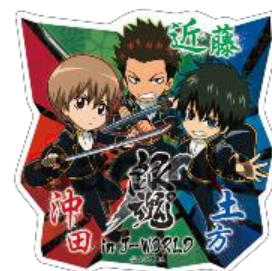
[大成功賞] アクリルバッジ(1種)