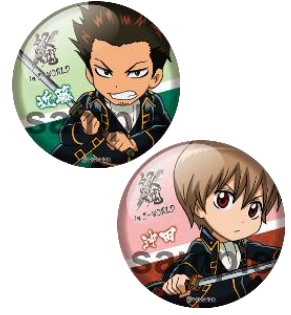
54mm 缶バッジ (6種)