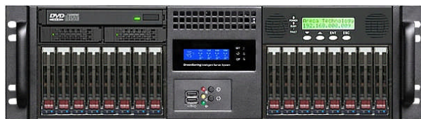
フロント (12Gbps 16 * 2.5"ベイ+RAID Cont.)