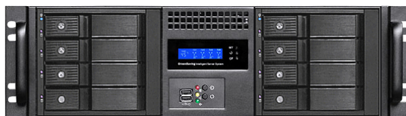
フロント (8 * 3.5" リムーバブルベイ)