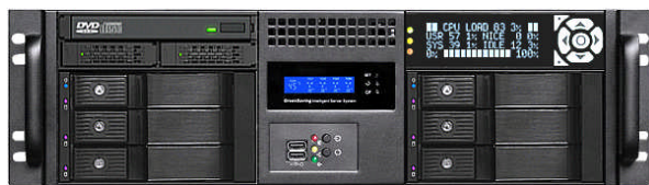
フロント (Slim ODD+2x2.5"ベイ+6 * 3.5"ベイ+グラフィック LCD)