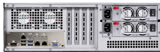
リア (L2/T2 リダント電源モデル)