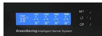
省エネコントローラ表示部