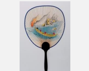
⑱うちわ(朝風鵜飼) 1枚 縦35cm、横21cm