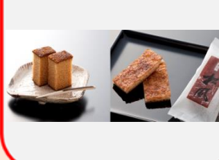
⑪松風セット 味噌松風 1本、松風 10包 20枚