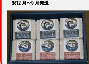
⑯キューブ米1ケース はつしも 300g×3、こしひかり 300g×3 ※12月～9月発送