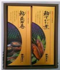
⑦岐阜あゆ自慢 2種 鮎昆布巻 1本 鮎すがた煮 75g