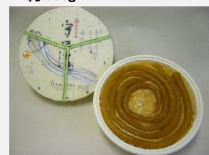
⑰守口漬け 樽シリーズ 約330g