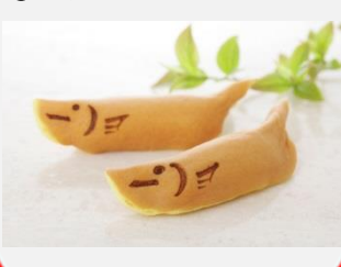
②飛あゆ(プレーン) 18個