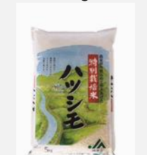
⑮岐阜県産特別栽培米 ハツシモ 5kg