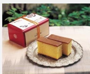
⑩フロイスから信長公へ 献上かすていら 1本