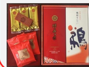
⑫長良川物語 鵜飼せんべい 12枚、信長の赤 10枚