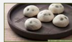
⑧枝豆まんじゅう 10個 ※4～11月発送（9月末までの入金要）