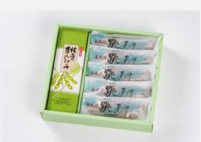
⑨ぎふ銘菓詰合せ 小 2種 枝豆まんじゅう、踊り鮎 各5個(変更有)