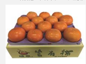
⑬富有柿 Lサイズ 14個 ※11月発送（9月末までの入金要）