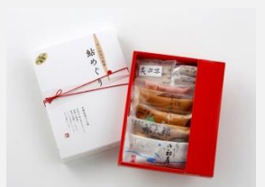
⑤長良川銘菓「鮎めぐり」 ※5～10月発送（8月末までの入金要）