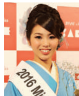
ゲスト: 田中沙百合 (2016 ミス日本酒)