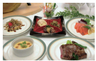
酒粕料理の盛り付け (参加酒蔵の酒粕を使用)