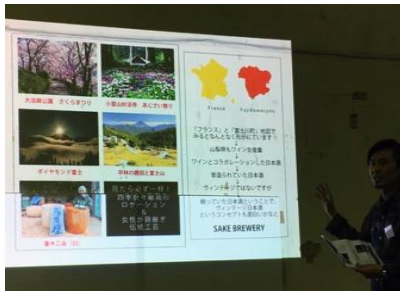
「チームのんBee」チームの発表