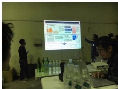
「まちいくしにお」チームの発表