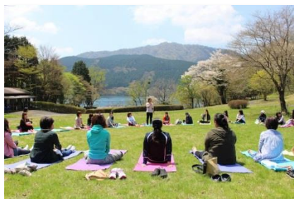
芦ノ湖も一望できる芝生の上でヨガを行います

開催日時 2016年4月24日(日) 11:00～15:00 (10:30受付開始) 教室(場所) ザ・プリンス 箱根芦ノ湖 別館ロビー前集合(九頭龍の森で解散) ※雨天の場合は芦ノ湖キャンプ村多目的ホールにて実施いたします。 参加費 はこじょ学生: 3,800円(税込) / 一般: 4,800円(税込) ※スペシャルランチ&箱根名産お土産付き 参加方法 はこじょWEBサイト、または事前電話予約の上現地参加も可 ※参加申込及び学生登録はWEBサイトから( www.hakojo.com ) 定員 25名(男性の方も参加女性のパートナーや同伴の方であればご参加いただけます) 主催 一般社団法人はこねのもりコンソーシアムジャパン 後援・協力 箱根ジオパーク推進協議会/ザ・プリンス 箱根芦ノ湖/箱根園 芦ノ湖キャンプ村/昭和女子大学 葉袋ゼミ