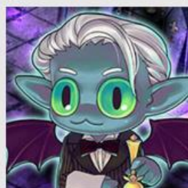
小悪魔フリークス