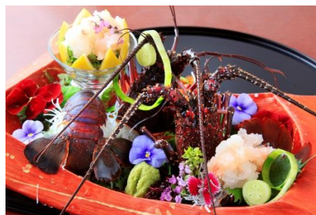
2 名様用伊勢えびお造りイメージ