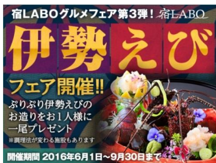
宿 LABO グルメ企画第 3 弾