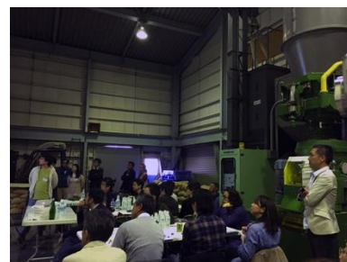
「ビシビシ本菱」チームの発表