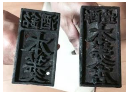
120年前当時、 実際に使われていた「本菱」の刻印

3回目のセッションとなる次回は、プロジェクトメンバー全員で、「本菱」の強み・弱みを整理し、仮説をたてることから始めます。その後、顧客を設定し、どんな人にファンになって欲しいかを議論します。これから復活する「本菱」が、どんな酒となり、誰に愛されるのか。その性格を決める大切な議論になります。