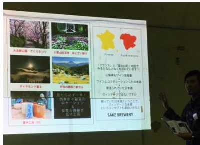
「チームのんBee」チームの発表