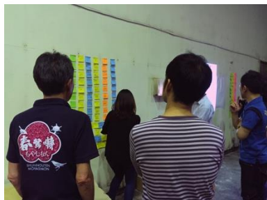
「まちいくしにお」チーム