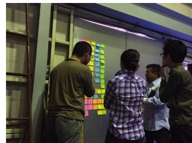
「ビシビシ本菱」チーム