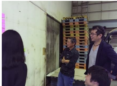
「チームのんBee」チーム