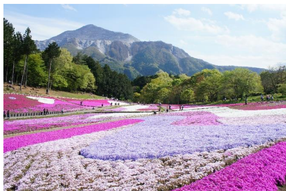
(写真:芝桜の丘『羊山公園』)

「ウォークインサイト(WALK INSIGHTS)」は、店舗のみならず、人の流れや動向を分析によるデータの可視化をすることで様々な業種・分野でご評価いただいております。