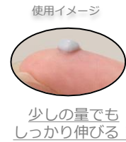
使用イメージ 少しの量でも しっかり伸びる！

※洗顔後、水気を十分に拭き取った清潔なお肌にお使いください ※週1～2回の使用がオススメ