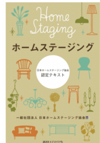
認定テキスト(表紙)

URL http://www.homestaging.or.jp/?cat=10