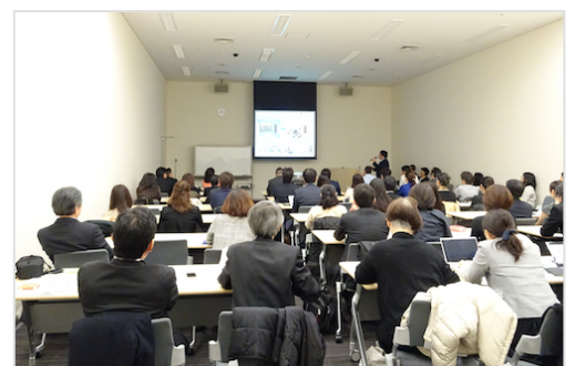
2016年2月の交流会で行われた特別講演の様子

また年1回、ホームステージャーと企業や関連分野の専門家が交流する交流会を開催しています。