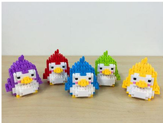
ブロックペンギン 1個…5名 (色は選べません)