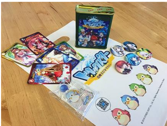
お土産セット…3名 (缶バッジ・カードはいずれか1種類です)