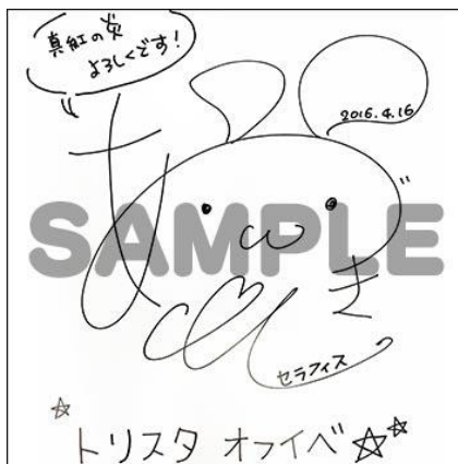
垂月ちえみさんサイン色紙…1名