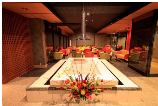
エントランスを彩る IRORI

~~~~~ 西伊豆土肥の温泉旅館【IRORI (いろり) ダイニング ゆとりろ西伊豆】(所在地：〒410-3302 静岡県伊豆市土肥 324) は、2015 年 11 月 14 日、囲炉裏を中心に～集う・語らう・食す～新しい感覚の IRORI (いろり) ～をテーマにリニューアルオープンした宿。今年 5 月で開業半年を迎え、平均稼働率 70% 以上と高い稼働率を誇る人気の宿に成長することができた。無事に開業から半年を迎えられた事を記念し、プレゼントを宿泊者に進呈することにした。今回の【祝開業半年】特別企画は、感謝の気持ちを込めるとともに、今後も幅広い年代に愛される宿として従業員一同新たな気持ちで臨んでいくための節目としての気持ちを込めた特別企画。