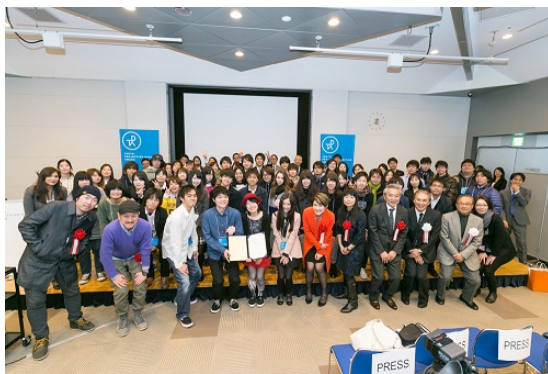
表彰式での記念撮影