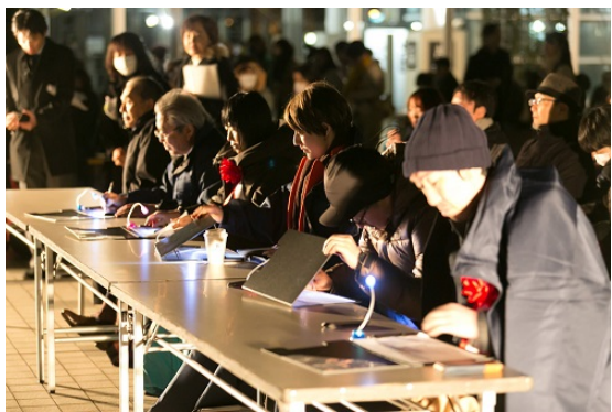
会場での審査の様子