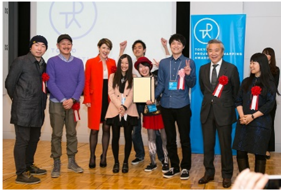
最優秀賞のチーム 首都大学東京