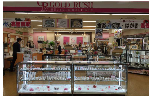
エブリデイゴールドラッシュ

いずれにせよ、担当の意地から生まれた景品が、まさかの全国中で広がり、話題の景品になろうとは思いませんでした。