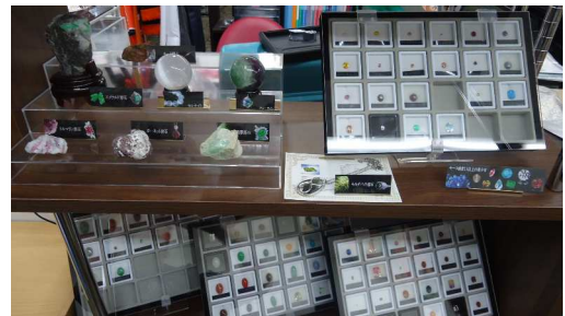
担当天沼の社内デスク