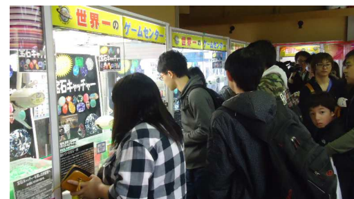
週末には最大3時間待ちも