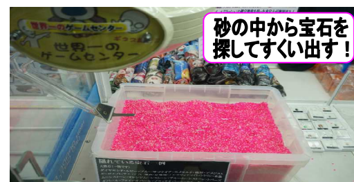
宝石キャッチャーの様子