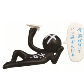
③今遊ばないで いつ遊ぶんだよ